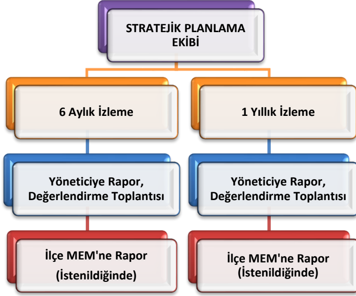
Şekil 2 Stratejik Plan İzleme ve Değerlendirme Modeli